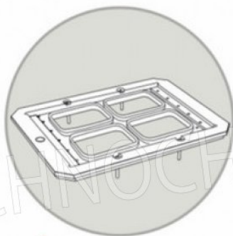
STAMPO GN 1/8 mm160x130 MOULD GN 1/8 mm 160x130