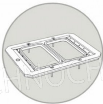
STAMPO GN 1/4 mm 265x160 MOULD GN 1/4 mm 265x160