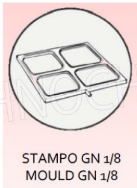
STAMPO GN 1/8 MOULD GN 1/8