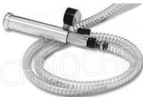
TUBO CON MANICOTTO ADATTATORE PER VUOTO IN CONT. GASTRO