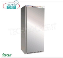
Porta, per 6 Teglie cm 60x40, Classe C, mod.G-ER500PSS