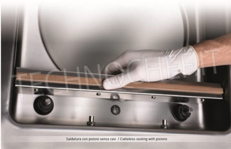
Saldatura con pistoni senza cavi / Cableless sealing with pistons