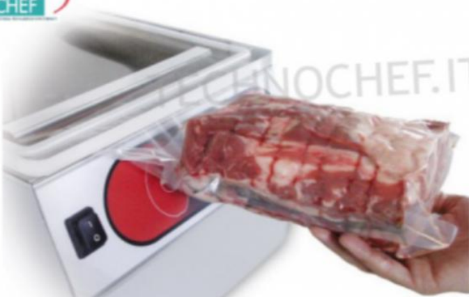
VUOTO ESTERNO CON BUSTE GOFFRATE