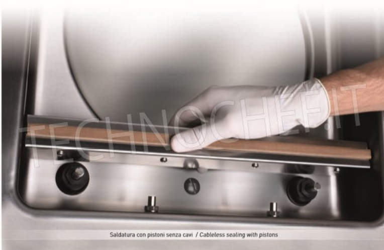
Saldatura con pistoni senza cavi / Cableless sealing with pistons